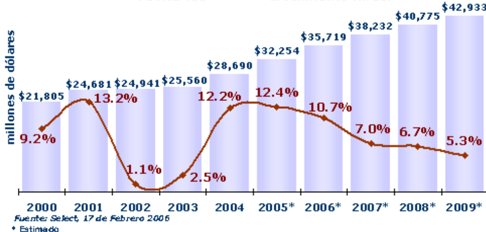
Desarrollo de la industria TIC en México 2000-2006 Incluye: Equipo+Software+Servicios TI+ Servicios Telecom

La industria de TIC en México, durante los últimos 5 años ha tenido un desarrollo moderado, influido en gran medida por el desempeño económico del país, pero caracterizado también por ciclos: Expansión (1999-2001): en esta etapa, la industria experimenta un fuerte crecimiento como consecuencia de la conjunción de diversos factores como: Crecimiento económico, adopción de sistemas empresariales (ERPs) y la oferta adecuada al consumidor de hogar. Desaceleración (2002-2003), influyen factores como entorno económico, sobre-inversión y lento aprovechamiento de la tecnología. Finalmente la Reactivación (2004-2006) que se distingue por estabilidad macroeconómica, desarrollo de la empresa mediana, gobernabilidad y transparencia.