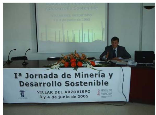
Celebración 1ª Jornada de Minería y Desarrollo Sostenible en El Villar