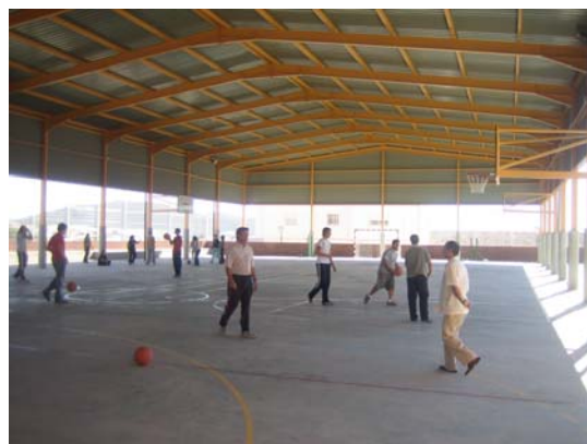
Pabellón deportivo cubierto del nuevo Instituto

Respaldaremos a las asociaciones deportivas de Villar y todas sus actividades. Solicitaremos financiación para la construcción de un pabellón cubierto que nos permita ampliar la oferta deportiva municipal.