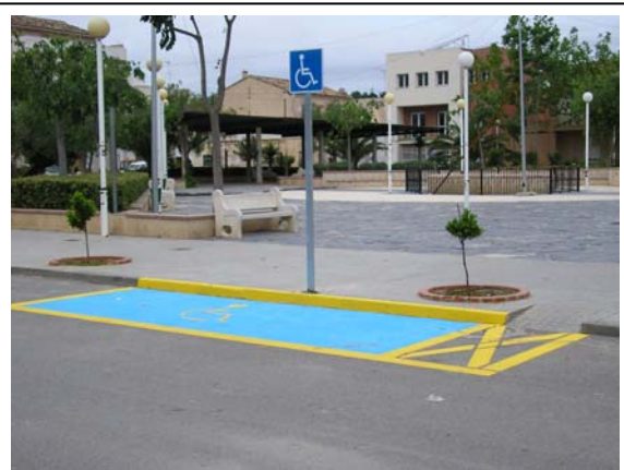
Acceso al Huerto del Señor y aparcamiento minusválidos

Se han modernizado los sistemas de trabajo de las oficinas con el fin de mejorar la atención al ciudadano incorporando nuevas tecnologías como la página WEB del ayuntamiento, creación del telecentro, Internet, etc.