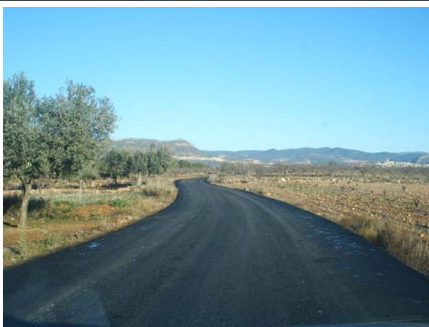
Asfaltado camino la Balsilla