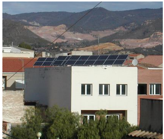
Paneles solares del Centro Social

Apoyaremos la instalación de industrias, en especial las llamadas industrias blandas con poco impacto ambiental para favorecer la creación de puestos trabajo.