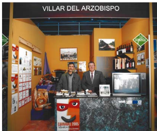
Participación en la Feria de Turismo de Valencia