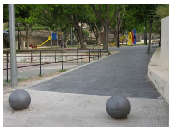
Acceso al parque de San Vicente