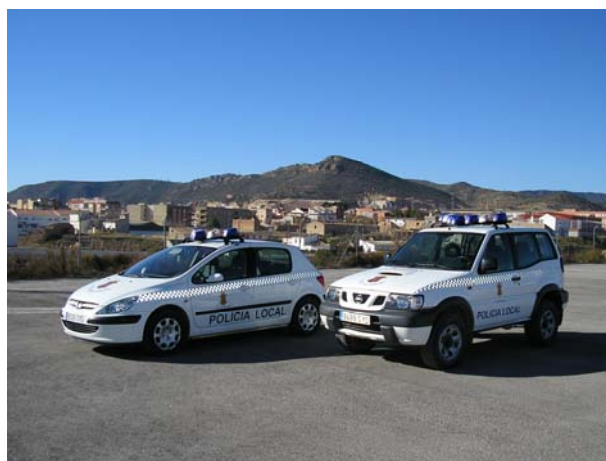
Nueva dotación de coches de policía