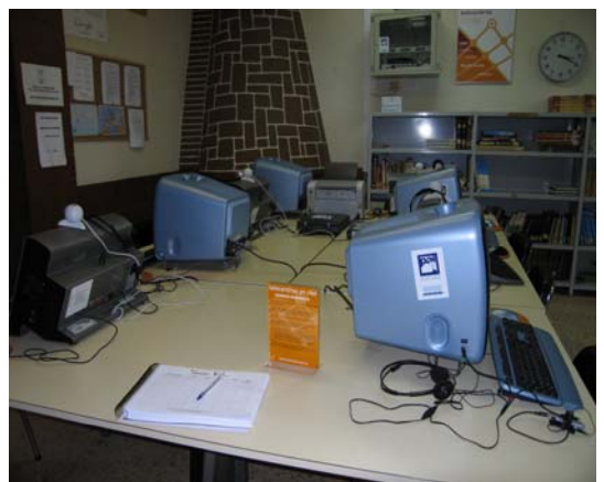
Instalación del telecentro en la Biblioteca Municipal