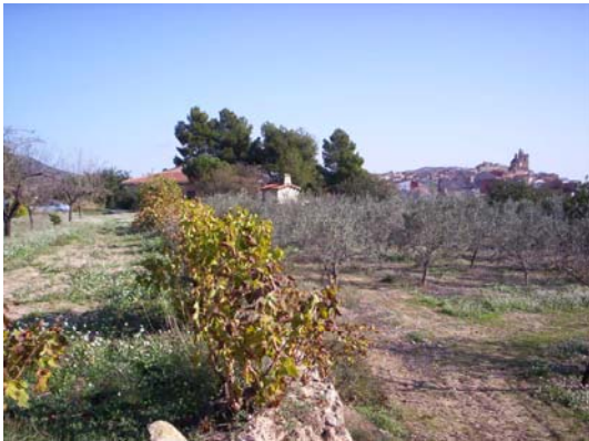
Terrenos adquiridos para la construcción de la Residencia.

Apoyaremos a las asociaciones de jubilados. Exigiremos la construcción de una Residencia Pública en los terrenos comprados por el Ayuntamiento.