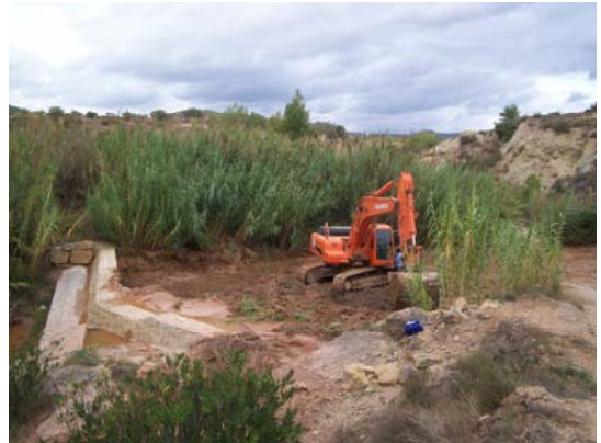
Construcción y posterior limpieza de un dique en la rambla Castellana

Continuaremos la línea emprendida durante estos 4 años donde se han desarrollado políticas respetuosas con el medio ambiente que nos permitan avanzar hacia un modelo de desarrollo sostenible. Se ha instalado la primera central solar municipal en el Centro social y hemos apoyado la instalación de dos huertos solares privados en nuestro término municipal, se está regenerando la mina Valencia de la WBB y rehabilitado el área recreativa de Cabiscot, limpiado la rambla y se han instalado más contenedores de papel, vidrio y plástico.