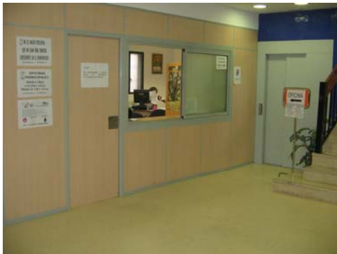
Oficinas municipales de atención al público con el nuevo ascensor que permite el acceso a todas las dependencias.

Seguiremos cumpliendo el convenio colectivo que por primera vez se ha firmado en este ayuntamiento y que mejora las condiciones laborales y económicas de todos los trabajadores municipales y que ha permitido un mejor servicio a todos los ciudadanos y cumplimiento del acuerdo firmado con la policía local que mejora sus condiciones laborales y económicas.