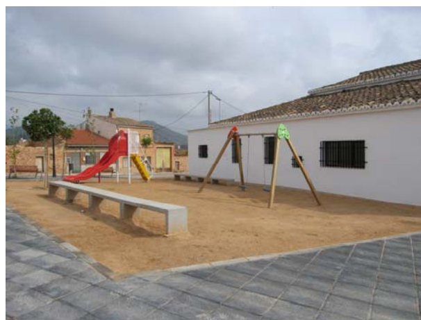
Urbanización de la Plaza del Lavadero